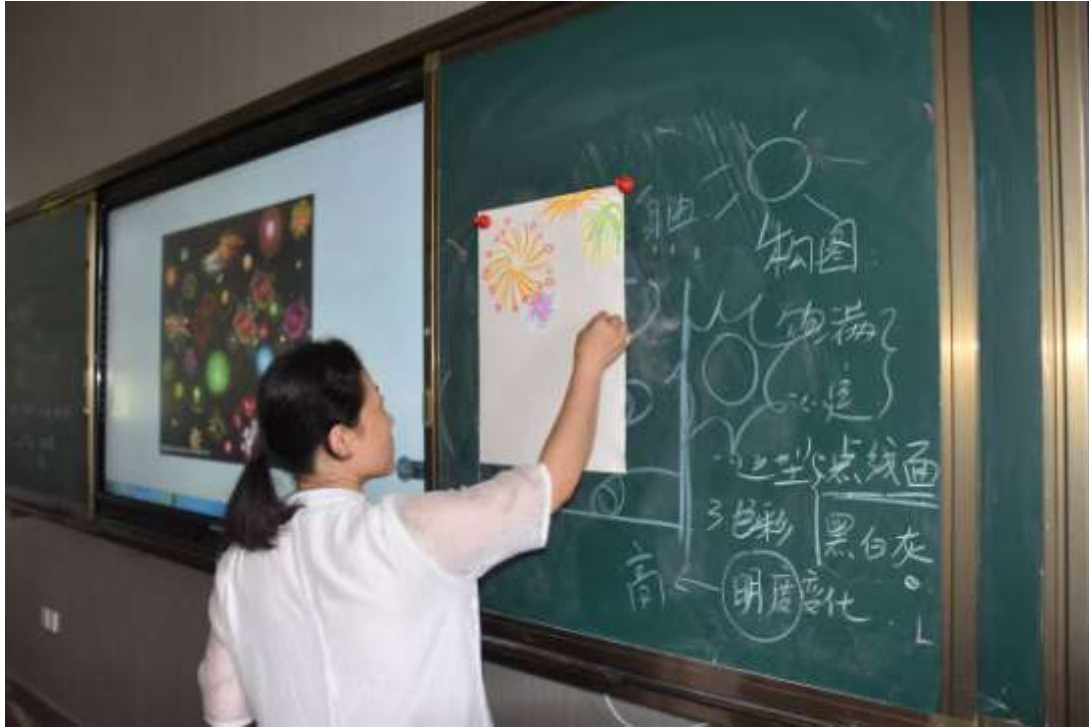
李老师引导学员们认识美术的基本语言 “构图、造型、色彩”。