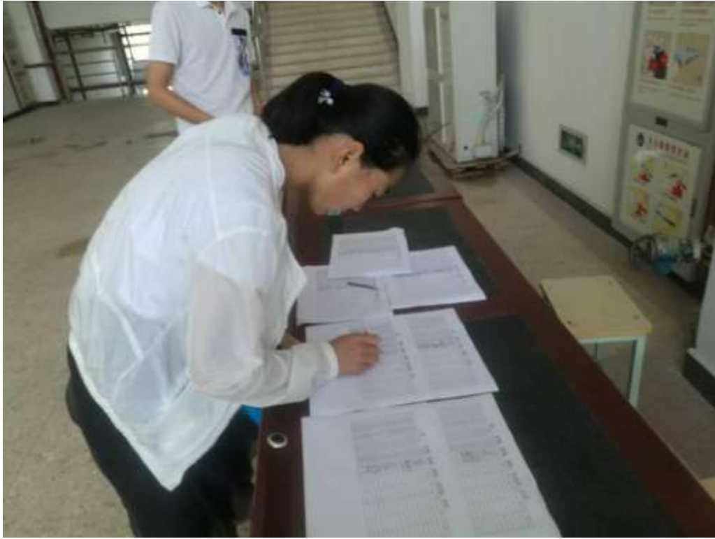
学员们在自觉签到。

虽然天气炎热，但所有的学员都能自觉遵守培训纪律，以旺盛的求知欲，饱满的学习热情顺利完成了第二期的学习任务。