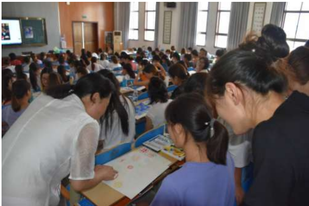
李老师在指导学员们绘画。